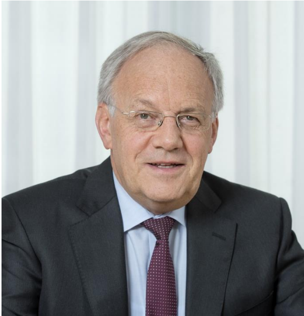
Johann Schneider-Ammann Chef Departement WBF